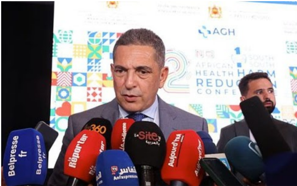
Pr Saaid Amzazi

En effet, le Professeur a rappelé l'ampleur de la catastrophe, mettant en évidence