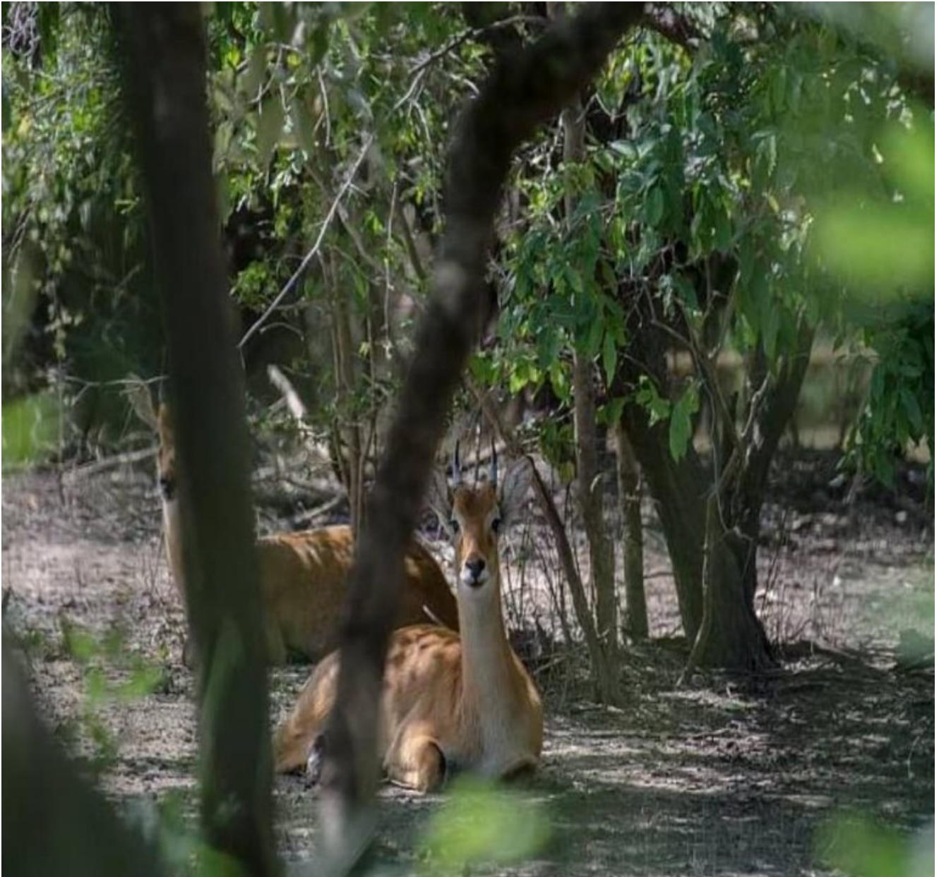
Une vue des animaux à l'intérieur du Parc W du Niger

Des éleveurs s'entendent avec des groupes armés au nord-est du complexe pour tirer avantage des pâturages, comme l'a rapporté un agent des eaux et forêts de Falmey au sud-ouest du Niger : « des transhumants sont complices des djihadistes qui prennent leur zakat et les laissent paître leurs bêtes dans le parc. Notre collègue, enlevé à Tapoa par des djihadistes il y a six mois, raconte que tous les matins, ils livrent du lait aux djihadistes dans des bidons. Les djihadistes prennent la zakat, mais ils les rassurent en leur garantissant la sécurité pour que nous les agents, ne les dérangeons pas ». Des propos confirmés par le Commandant Kpidiba Bonaventure dans les