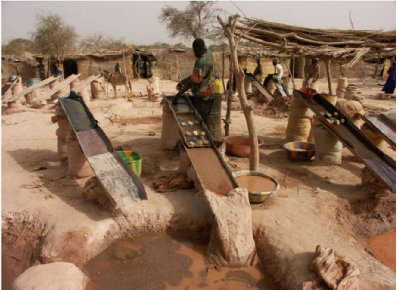
Site clandestin d'orpaillage / Ph : DR

L'exploitation de l'or par les groupes armés terroristes est connue des autorités burkinabè. C'est ainsi que lors du Conseil des ministres du 24 mai 2023, le Gouvernement a mis en place un groupe de réflexion pour faire des propositions d'actions pour « l'assèchement des financements du terrorisme à partir de l'exploitation minière artisanale ».