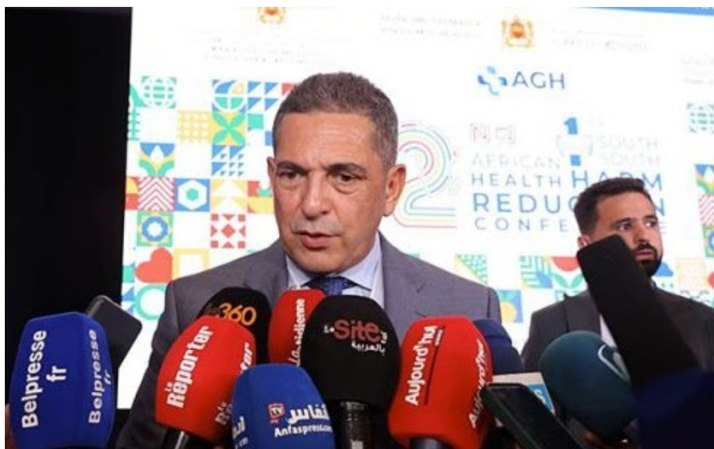
Pr Saaid Amzazi

En marge de la 2e édition de la Conférence Africaine sur la réduction des risques en santé, une table ronde spéciale a rassemblé d'éminents experts autour du thème « Catastrophes naturelles : Réduction des risques et gestion des urgences ». Le panel a été présidé par le Pr Saaid Amzazi du Maroc, qui est revenu sur le séisme dévastateur ayant secoué la région du Haut Atlas, au sud de Marrakech, le 8 septembre dernier.