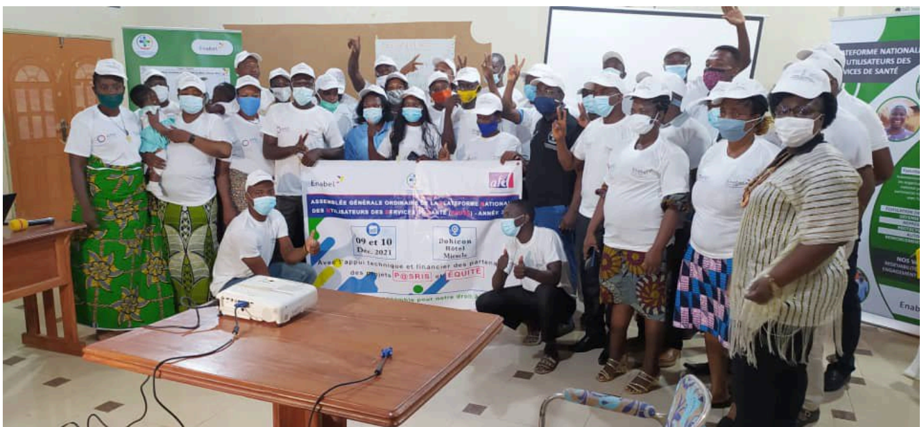
Photo de famille AGO PNUSS 2021

Avec l'appui technique et financier du Programme d'Appui à la Santé Sexuelle et Reproductive et à l'Information Sanitaire (PASRIS), la Plateforme Nationale des Utilisateurs des Services de Santé (PNUSS), respectueuse des textes qui le régissent, a organisé sa première Assemblée Générale Ordinaire les 09 et 10 décembre 2021 à l'hôtel Miracle de Bohicon.