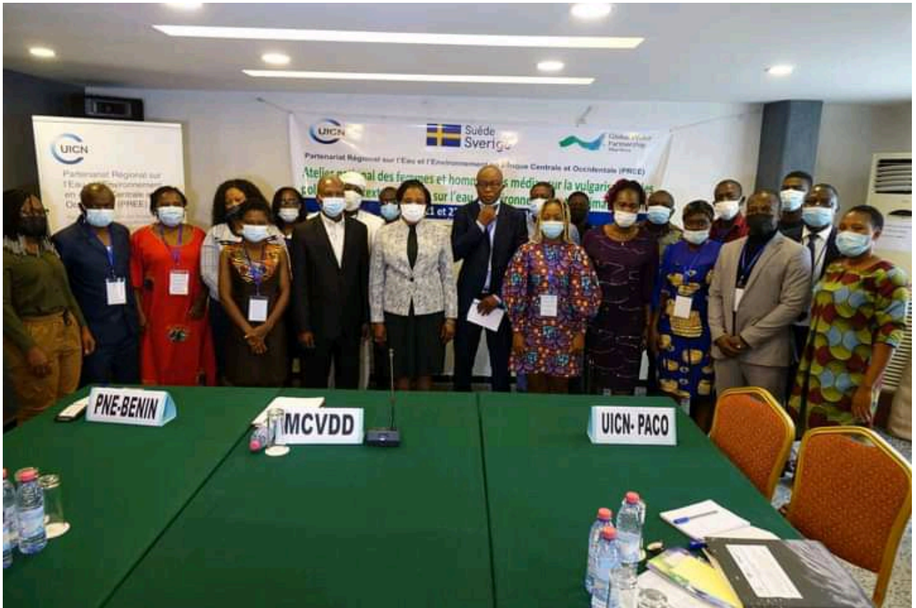
Photo de famille Atelier PNE UICN PACO GWP A0

Tout en s'engageant pour une large vulgarisation des politiques et textes adoptés sur l'eau, l'environnement et le climat, les femmes et hommes des médias participants ont su produire des messages et articles de presse écrite, audio et audiovisuelle.