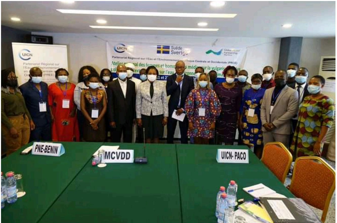
Photo de famille Atelier PNE/UICN PACO/GWP/AO

L'exacerbation des événements climatiques extrêmes dont la sécheresse et les inondations en Afrique de l'ouest, conséquences du réchauffement climatique, justifie l'organisation d'un atelier national au profit des médias au Bénin.