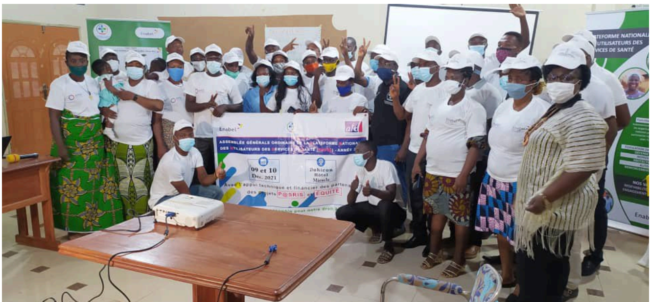
Photo de famille AGO PNUSS 2021

Avec l'appui technique et financier du Programme d'Appui à la Santé Sexuelle et Reproductive et à l'Information Sanitaire (PASRIS), la Plateforme Nationale des Utilisateurs des Services de Santé (PNUSS), respectueuse des textes qui le régissent, a organisé sa première Assemblée Générale Ordinaire les 09 et 10 décembre 2021 à l'hôtel Miracle de Bohicon.