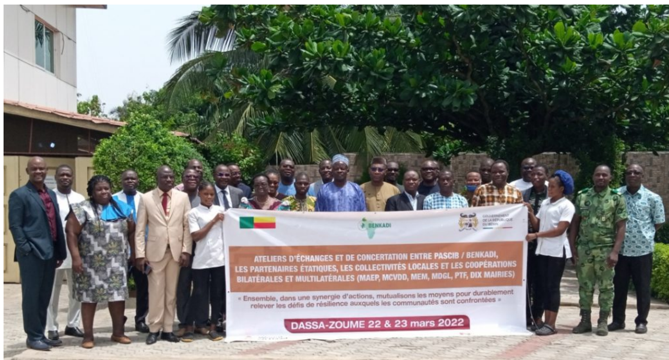
Photo de famille PASCiB Benkadi Acteurs Stratégiques

L'objectif de cette rencontre est de créer les conditions d'une pleine participation et d'une implication effective des partenaires stratégiques pour mieux faire face aux multiples enjeux liés au changement climatique en Afrique de l'ouest en particulier au Bénin.