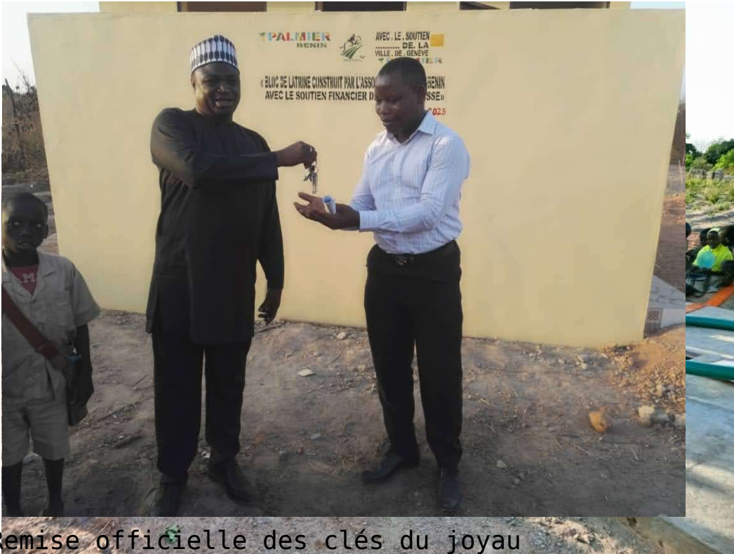
Remise officielle des clés du joyau Les écoliers de l'EPP Gomboko

La re mi se of fi ci el le du jo ya u a eu li eu ce ma rd i 14 ma rs 20 23 et a co nn u la pr és en ce du