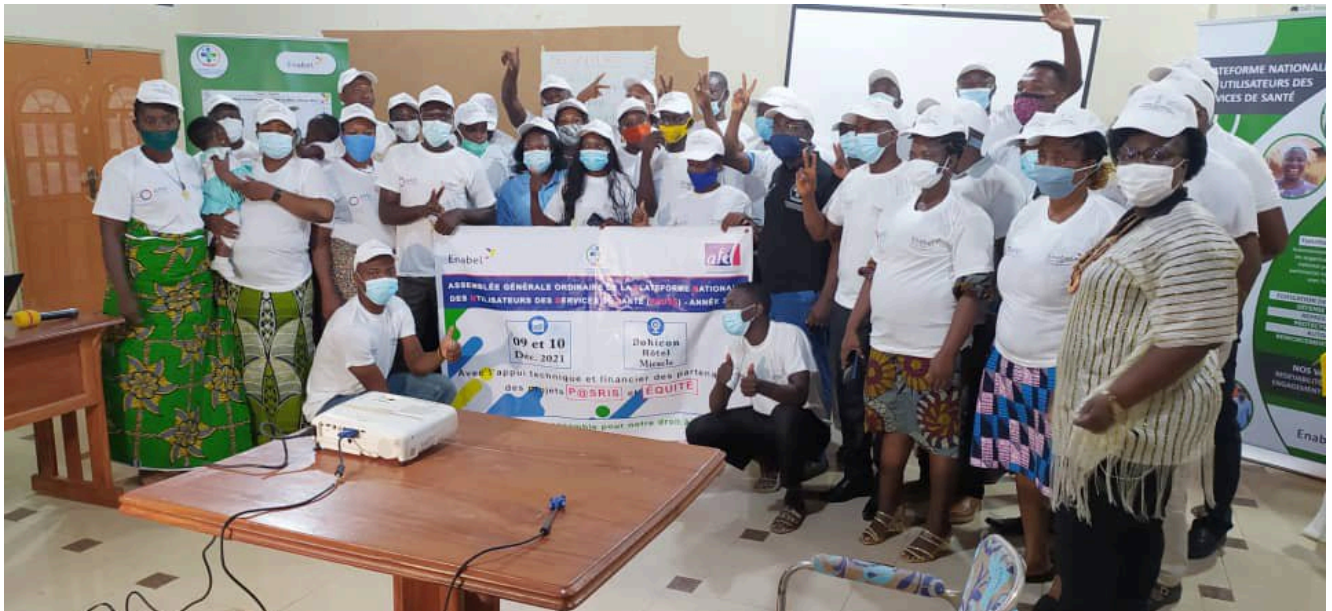
Photo de famille AGO PNUSS 2021

Le respect des textes fondamentaux doit être le leitmotiv de toute association qui se veut sérieuse et ambitieuse. C'est ce qu'à compris l'équipe dirigeante de la Plateforme Nationale des Utilisateurs des Services de Santé, qui, conformément à ses statuts, a tenue son Assemblée Générale Ordinaire.