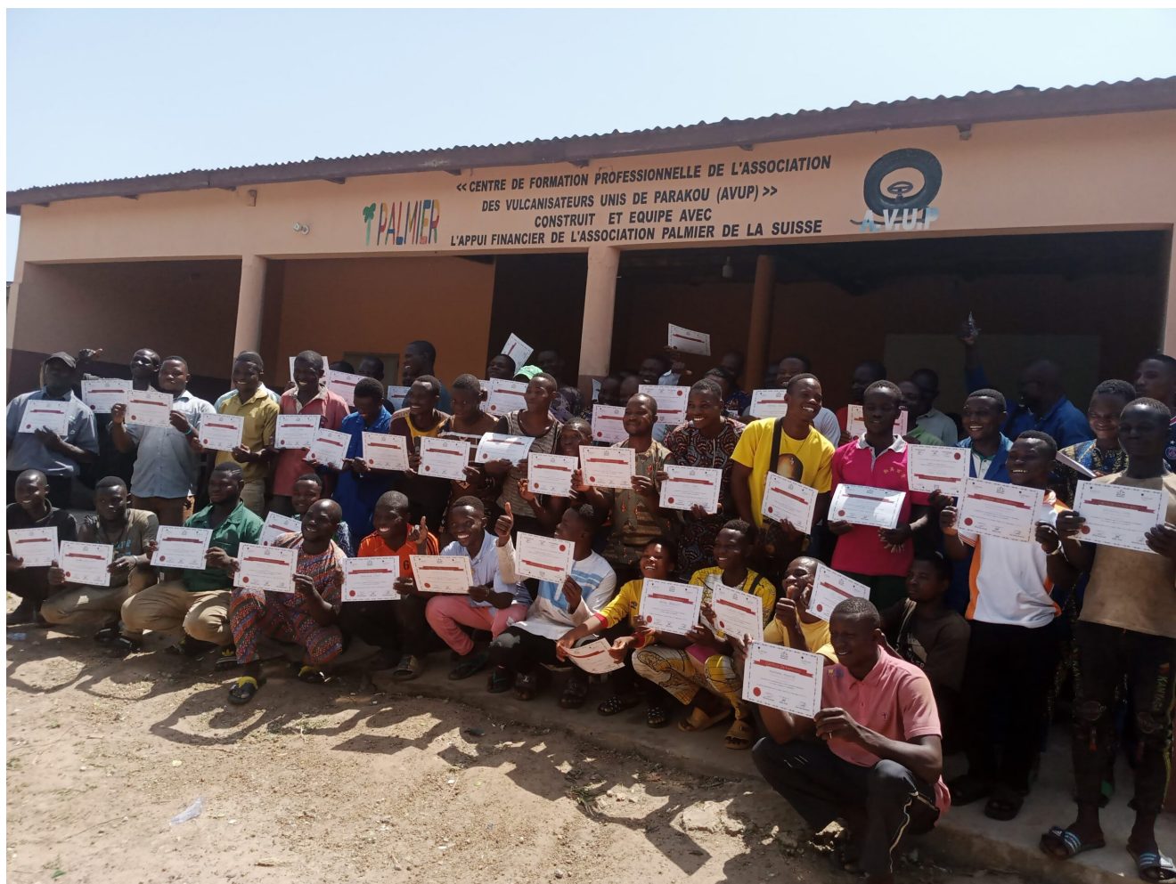
Photo des participants attestés

président de Palmier Bénin, invite les participants à faire preuve de pragmatisme une fois retournés dans leur atelier respectif. « Qu'ils mettent en pratique toutes les connaissances qu'ils ont eues à bénéficier au cours de la formation, afin qu'ils puissent se perfectionner et s'épanouir davantage dans leur métier », a-t-il exhorté.