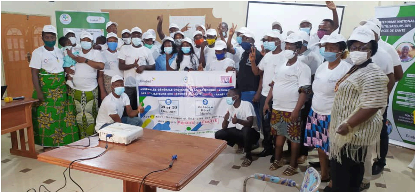
Photo de famille AGO PNUSS 2021

régissent, a organisé sa première Assemblée Générale Ordinaire les 09 et 10 décembre 2021 à l'hôtel Miracle de Bohicon.